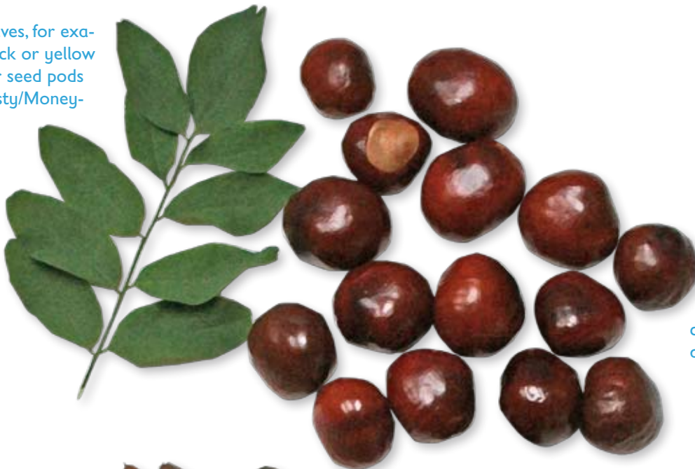
chestnuts in different sizes

dried leaves, for example black or yellow locust or seed pods of Honesty/Moneywort